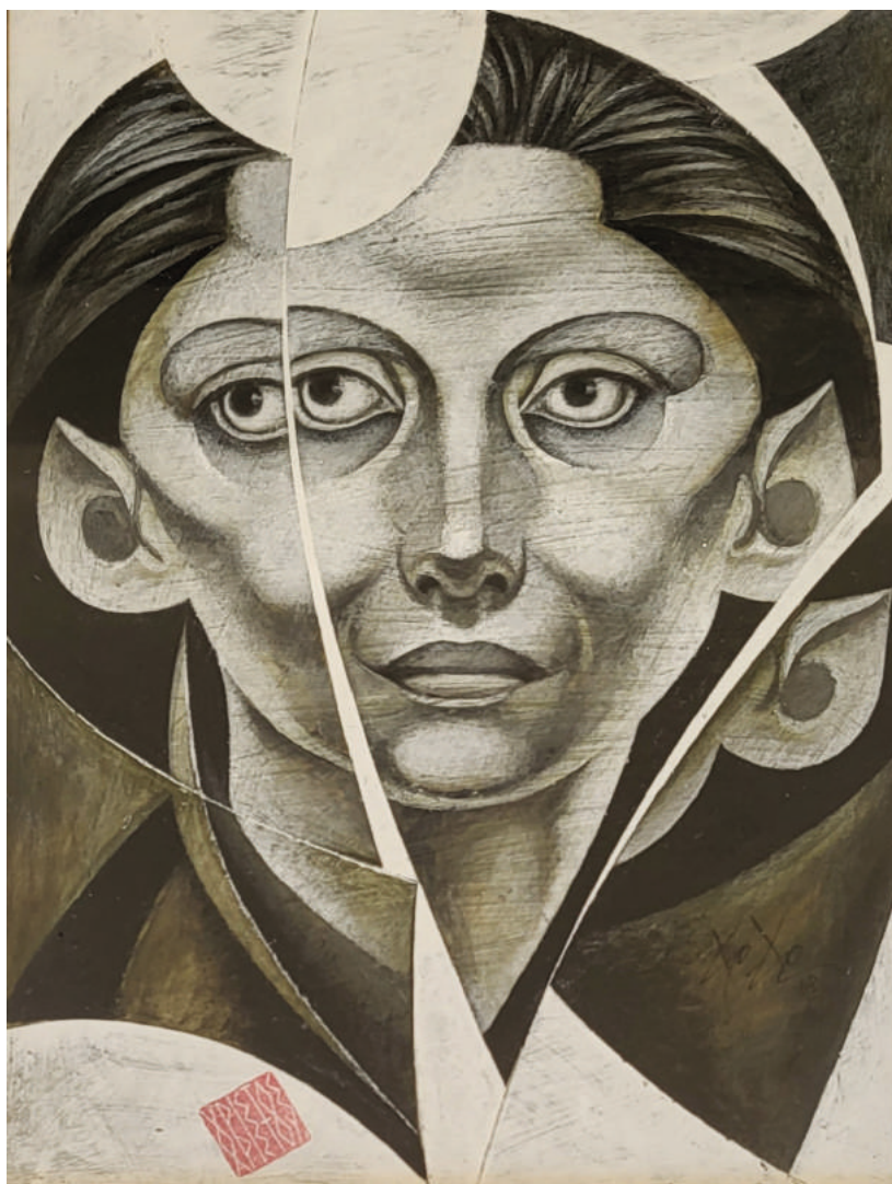
14. Portrait dans un Miroir Brisé (A) Προσωπογραφία σε Σπασμένο Κάτοπτρο (A)

Date / Χρονολογία: 2018 Dimensions / Διαστάσεις: 37cm x 26cm Medium / Υλικό: Acrylic on Paper (framed)