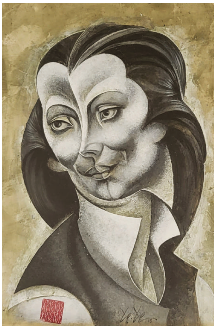
16. Portrait (A) Προσωπογραφία (Α)

Date / Χρονολογία: 2018 Dimensions / Διαστάσεις: 35cm x 25cm Medium / Υλικό: Acrylic on Paper (framed)