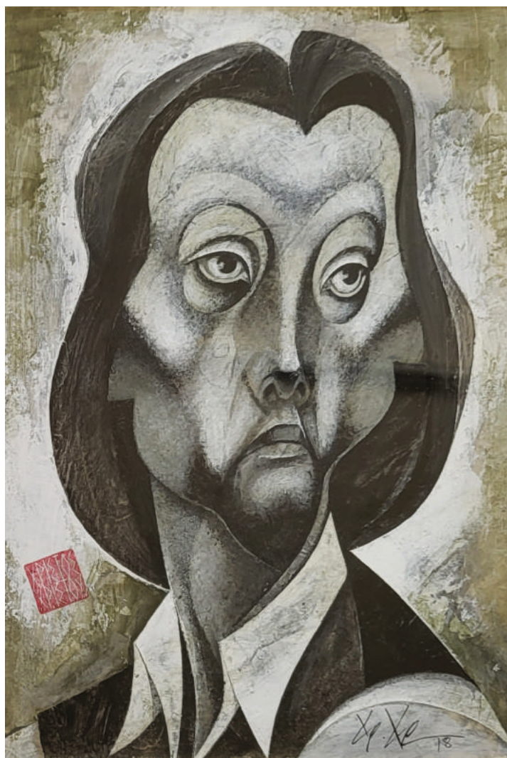
17. Portrait (B) Προσωπογραφία (B)

Date / Χρονολογία: 2018 Dimensions / Διαστάσεις: 35cm x 25cm Medium / Υλικό: Acrylic on Paper (framed)