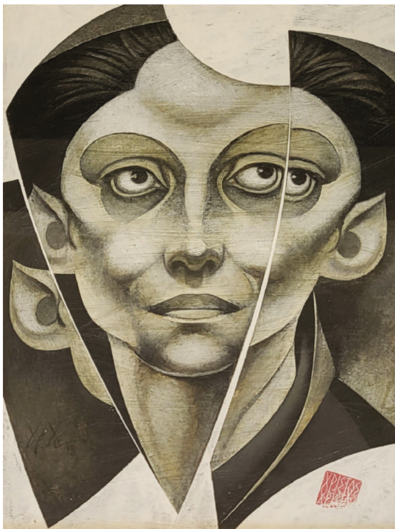
15. Portrait dans un Miroir Brisé (B) Προσωπογραφία σε Σπασμένο Κάτοπτρο (B)

Date / Χρονολογία: 2018 Dimensions / Διαστάσεις: 37cm x 26cm Medium / Υλικό: Acrylic on Paper (framed)