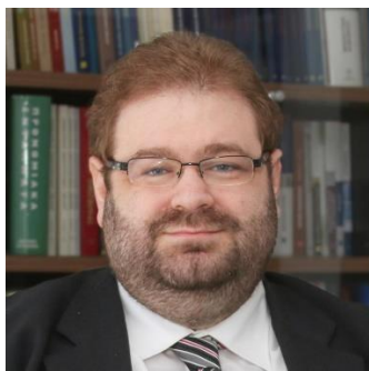
Καθ. Αχιλλέας Αιμιλιανίδης

Ο Αχιλλεύς Κ. Αιμιλιανίδης είναι Καθηγητής και Κοσμήτορας της Νομικής Σχολής του Πανεπιστημίου Λευκωσίας, δικηγόρος, διδάκτωρ δικαίου του Αριστοτελείου Πανεπιστημίου Θεσσαλονίκης. Έχει εκλεγεί